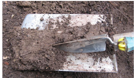
Probeentnahme mit einem Spaten